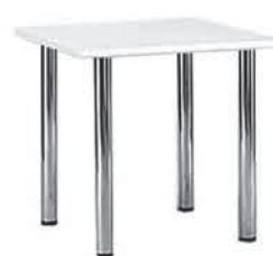
MT 065 Tisch, weiss/rechteckig, 75 x 75 cm