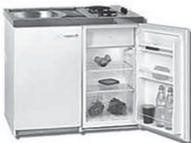
MS 045 Miniküche 88 x 100 x 60 cm