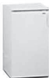
MS 047 Kühlschrank, weiss, 88 x 55 x 60 cm