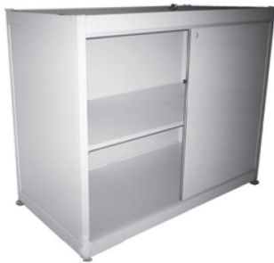
MZ 080 Sideboard