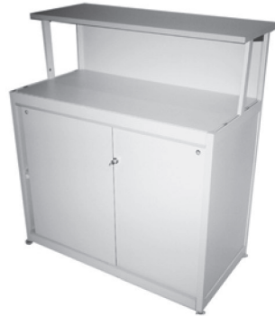
MZ 125 Bartheke