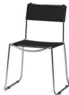
MS 019 Lederstuhl schwarz/chrom