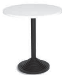
MT 038 Tisch, weiss/rund, H 70 cm, Ø70/80 cm