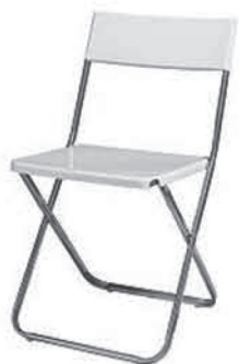
MS 014 Klappstuhl weiss