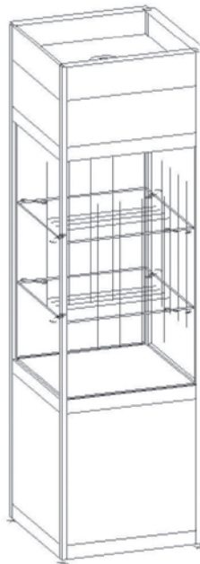
VIT 02 Turmvitrine 250 x 70 x 50 cm