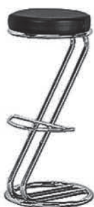
MS 026 Barhocker schwarz/chrom