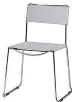
MS 018 Lederstuhl grau/chrom