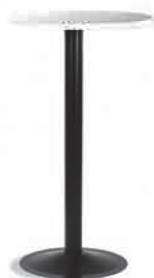
MT 025 Stehtisch, weiss/rund, H 111 cm, Ø60 cm