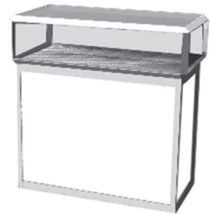
VIT 011 Glasaufsatztheke