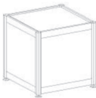
MZ 090 Podest in verschiedenen Größen